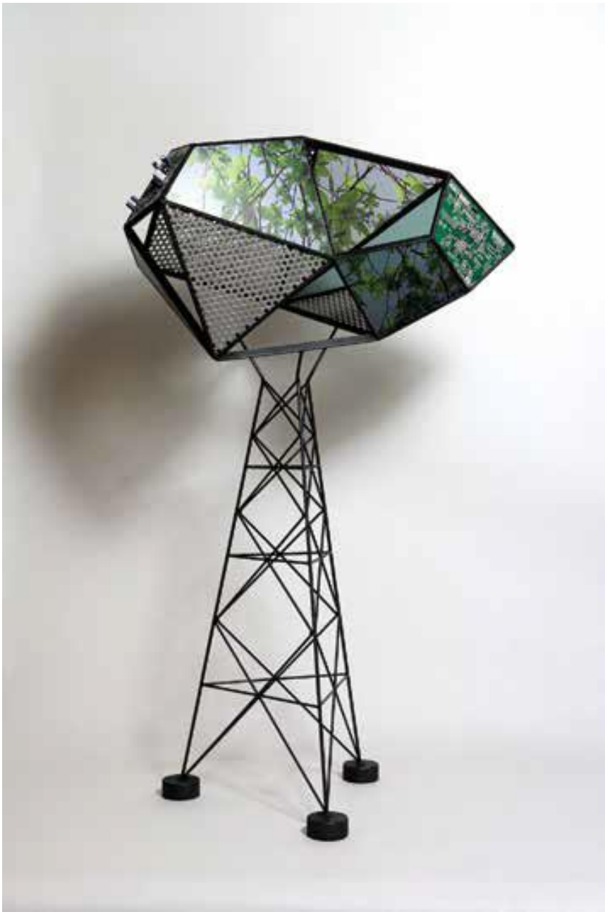
Drevesni delec za digitalno fotosintezo F – 786, 2013 jeklo, polimetylmetakrilat, vezje, print, 78,6 × 47 × 35 cm

Boštjan Drinovec je rojen 1973 v Ljubljani. Akademski kipar (1998, ALUO, Ljubljana). Magister umetnosti (2001, ALUO, Ljubljana). Od leta 2008 predava na ALUO v Ljubljani. Ustvarjalec Metelkove mesta. Boštjan Drinovec ustvarja na področju kiparstva, od male plastike do mobilnih, svetlobnih in zvočnih skulptur ter v svojem ustvarjanju združuje figuraliko s prvinami sodobnega kiparstva, konstruktivizma, poparta, modernizma in sodobnih trendov. Umetnik premišljeno črpa iz pretekle zgodovine znanosti in kiparstva - ne v smislu stilnih povzemanj, temveč v smislu funkcionalnih rešitev, prirejenih lastnim konceptom posameznih plastik pri katerih je zanj pomembna predvsem likovna oziroma estetska dovršenost forme. Pri svojem delu se ozira po tehničnih in inovativnih poteh Nikola Tesle, ki mu je izredno blizu in njegovih odkritjih. Poudarek daje vidnosti jasnih principov v povezavi s principi in znanjem s področja Tesle, njegov znanstveni in umetniški performans, in v nasprotju današnji digitalizaciji vstopa v zgoščen notranji proces uporabnika.