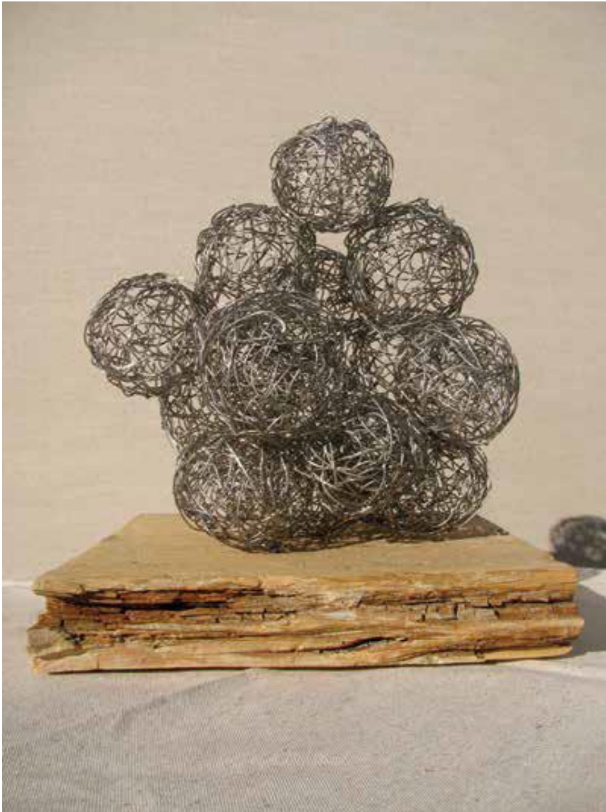
Vezi II, 2014 jeklena žica, les, 32 × 28 × 30 cm