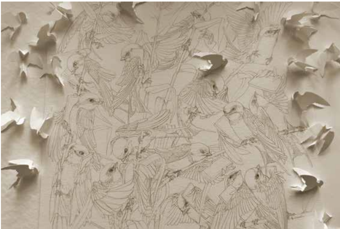
Kmečka lastovka 9, (Hirundo rustica), 2014 svinčnik, kirigami živali