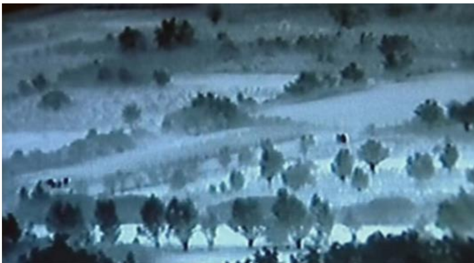
Posnetek iz videa Razglednice