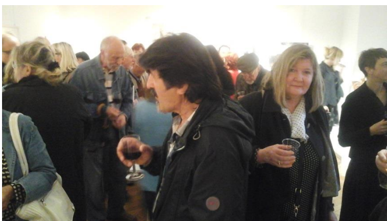
Veliko je bilo obiskovalcev letošnjega MS

Lep pozdrav in za vsa nadaljnja vprašanja smo vam na voljo na spodnjem naslovu.