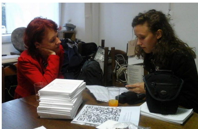
in v pogovoru z novinarki